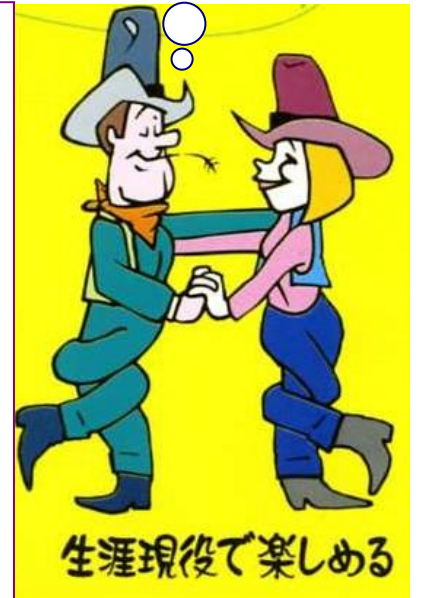
生涯現役で楽しめる

スクエアダンスを通して 新しい出会い！ 新しい仲間！ コミュニケーションづくり！