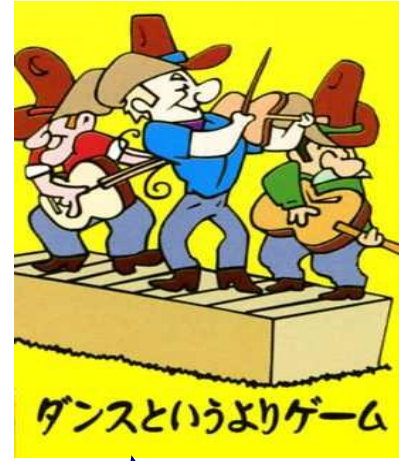
ダンスというよりゲーム

熱心なコーラーが 繰り返し繰り返し 指導しますので 全くの初心者でも 安心して 参加できます