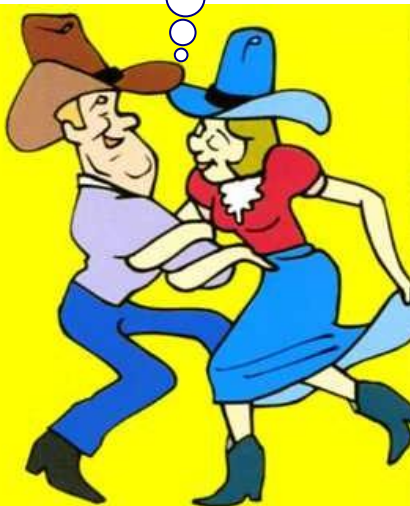
どこの国でも踊れるヨ